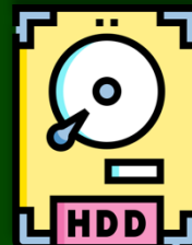
HARD DISK DRIVE