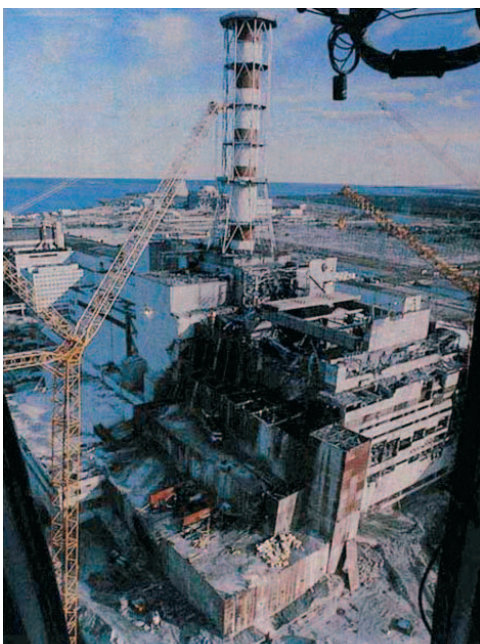
▲ Centrale nucleare di Chernobyl

zioni), Sellafield (Gran Bretagna 1957 - 300 decessi per cause ricondotte all'incidente), Three Mile Island (Harrisburgh, Usa 1969 - 3500 persone evacuate), Chernobyl (Unione Sovietica 1986 - 300 decessi al momento e 2500 nel periodo successivo per malattie e cause tumorali) sono solo alcuni dei principali incidenti di cui si è avuta conferma ufficiale dato che tanti casi sono coperti dal segreto militare.